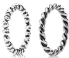
Połącz go z kolejnymi w różnych stylach