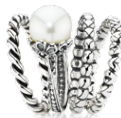
... i stwórz własny niepowtarzalny ZESTAW PIERŚCIONKÓW

Wydrukuj tę stronę w formacie A4 i przyłóż jeden ze swoich pierścionków do wybranego koła. Gdy koło i wnętrze pokrywają się – znalazłaś swój rozmiar!